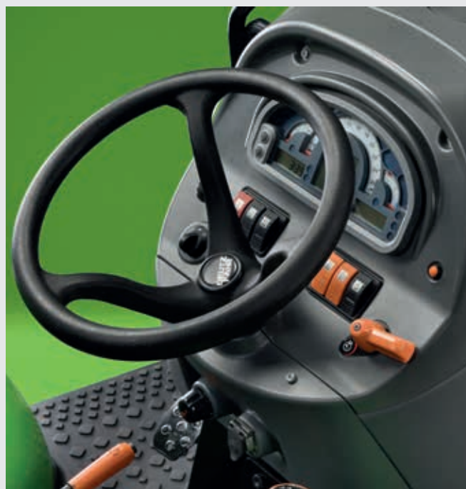
Memoria regime motore. Salvataggio e richiamo di un regime di rotazione da un semplice pulsante.

un catalizzatore DOC e un filtro DPF passivo, senza richiedere l'impiego di AdBlue o di combustibile aggiuntivo.