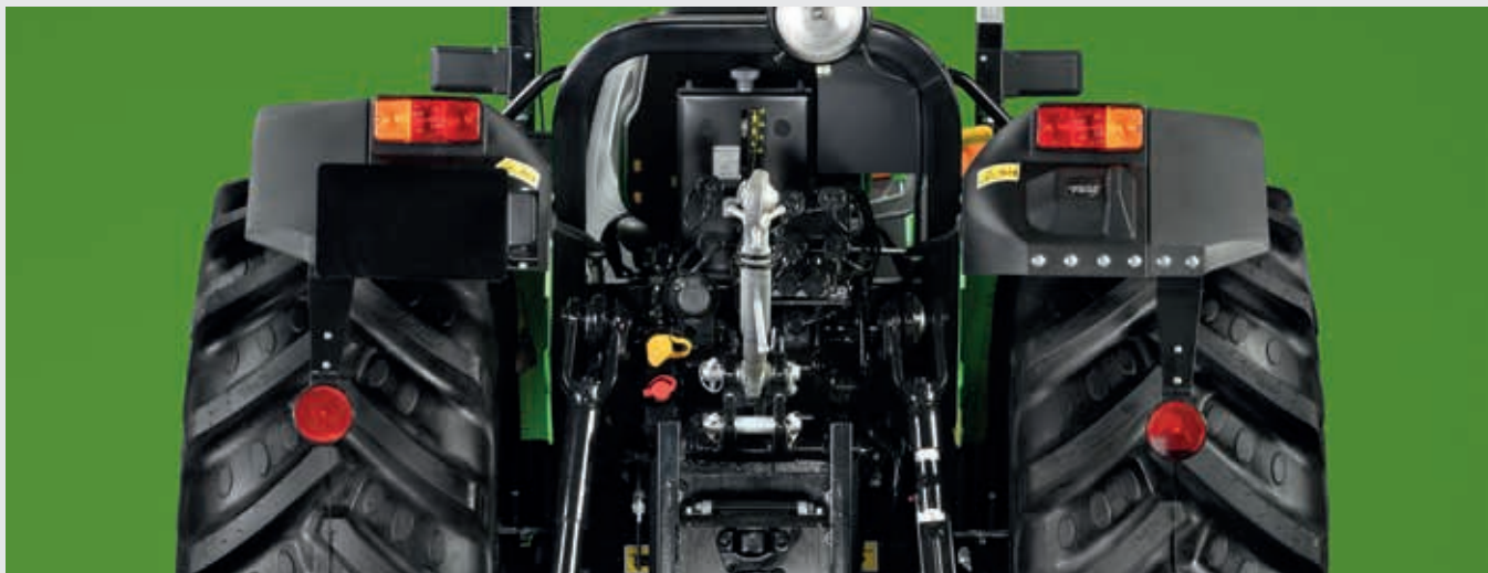
↑ Fino a 3 distributori meccanici posteriori.

Per attività di trasporto e trasferimenti su strada in sicurezza, su richiesta, è anche disponibile un freno idraulico rimorchio a doppia modalità.