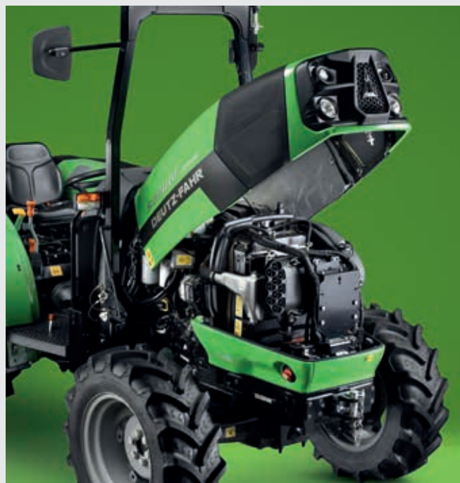
Facilità di manutenzione grazie al cofano monopezzo ad ampia apertura.

I modelli 5DF Keyline si caratterizzano per i potenti motori FARMotion 35 con coppia elevata e turbocompressore con intercooler. Il sistema di Iniezione Common Rail a controllo elettronico (con pressione massima di 2.000 bar), insieme alla ventola viscostatica dà vita a uno straordinario pacchetto di soluzioni tecnologiche per ottimizzare l'efficienza della combustione massimizzando le performance e riducendo al minimo i consumi di carburante. Inoltre, un nuovo impianto di preriscaldamento assicura avviamenti rapidi e sicuri anche con i climi più rigidi. Analogamente ai modelli di potenza superiore, il regime di rotazione massimo è di soli 2.200 giri/min, mentre sul modello 80 la riserva di coppia arriva a ben il 28%. La conformità allo Stage V in tema di emissioni inquinanti si ottiene grazie a un sistema di post-trattamento che abbina un circuito EGR raffreddato esterno,