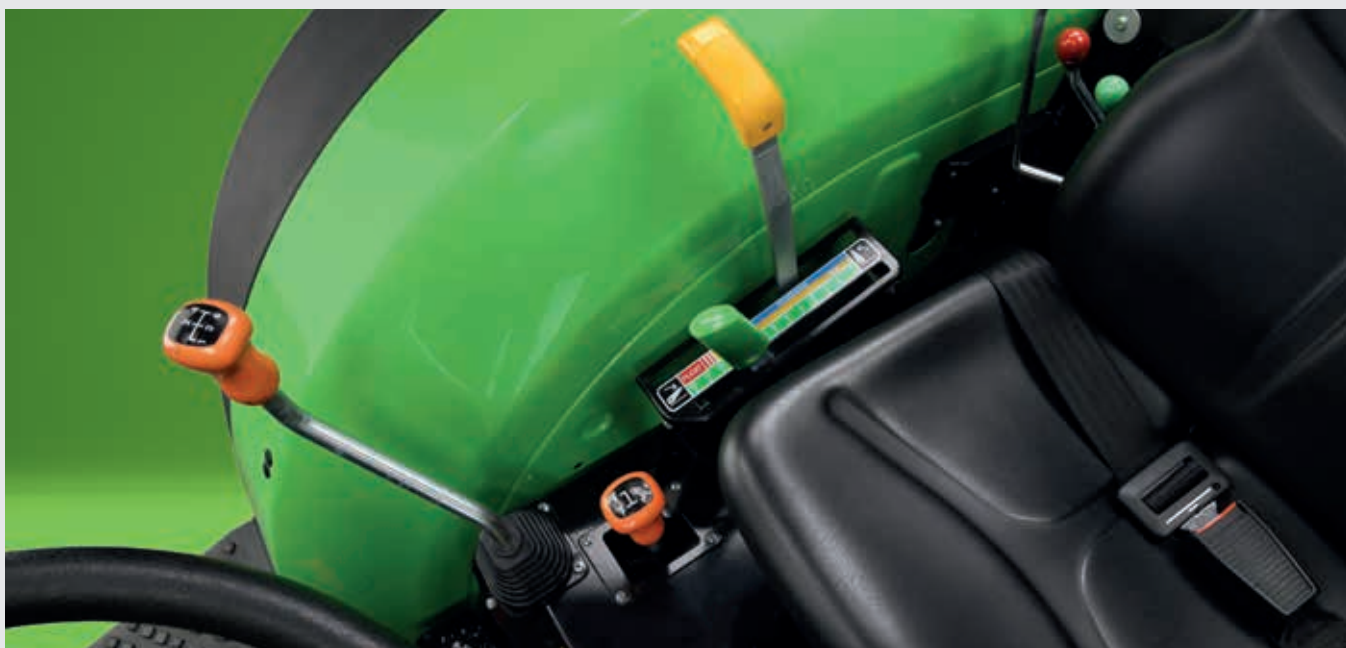
↑ Preciso sollevatore posteriore meccanico semplice da controllare.